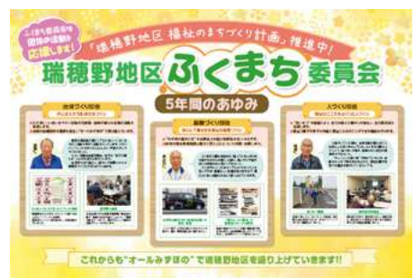
▲ パネルを作成し活動をPR ▲