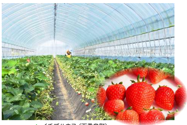
▲ イチゴハウス (下桑島町)