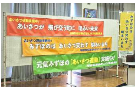
▲ のほり・横断幕の作成とあいさつ運動の実施 ▲