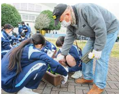
▲ 中学生と連携した花植え活動（高齢者福祉施設にプレゼント） ▲