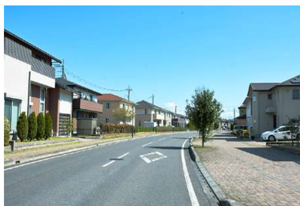
▲ 都市化された街並み (緑の郷)