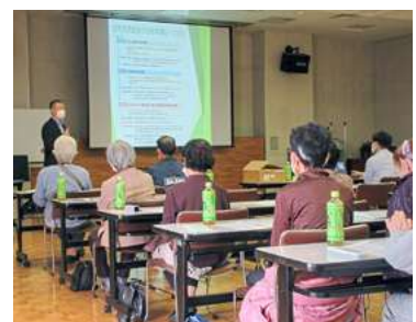
▲ 認知症予防講座の開催支援 ▲