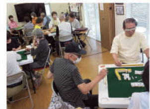
サークル活動 ～麻雀～