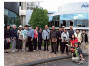
親睦旅行での記念撮影

また、9月よりクラブのグループLINEを立ち上げました。会員同士、日常の様々な情報交換、近況報告等を発信しているところです。