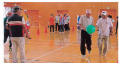
体育大会のようす

行事企画・開催にあたっては、機関紙に掲載される各地区・クラブの活動をいつも参考にさせていただいています。ありがとうございます。