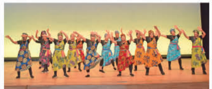
No.6 (河内地区) 岡本台ハイツゆうゆうクラブ