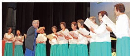
No.8 (中央地区) あざみの会