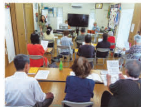
サークル活動 ～歌う会～