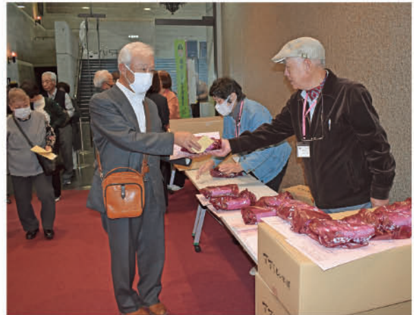
連合会創立60年のお祝いを兼ねて、参加者全員に赤飯をお渡ししました。