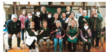
勾玉付けて「ハイ、チーズ!」