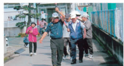
歩け歩け大会のようす