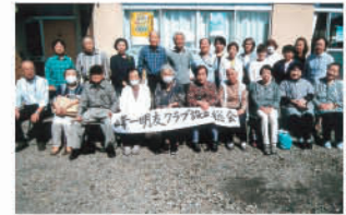
会員一同記念撮影

活動が始まったばかりですが、宇老連と連携を図りながら楽しい活動を進めたいと思っておりますのでよろしくお願いいたします。