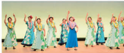
No.2 (陽光地区) フラ陽光