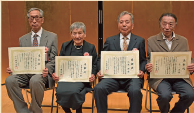
各部門代表受領者