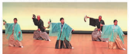
No.9 (ゲスト) 扇翠流吟詠剣詩舞扇翠会