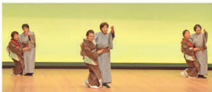
No.4 (横川地区) いきいきクラブ平松本町女性の会