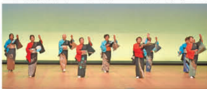
No.7 (上河内地区) 上小倉老人会光明会