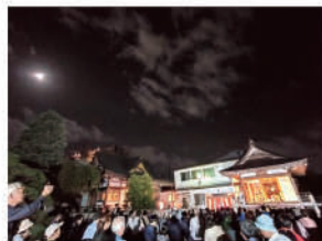
ウォーキング ～今泉八坂神社観月会～