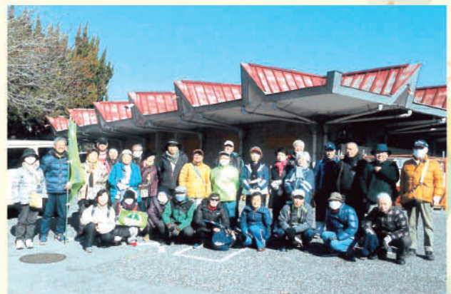
地区歩け歩け大会 ～和気あいあい楽しく～