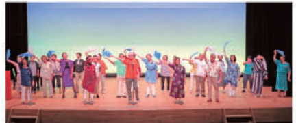
No.3 (富士見地区) 富士見地区老人クラブ