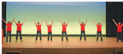
No.5 (その他) 陽光健康づくり推進協議会