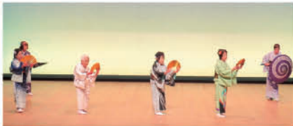
No.1 (雀宮地区) 雀老連新舞踊の会