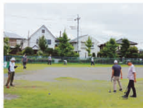
サークル活動 ～グラウンドゴルフ～