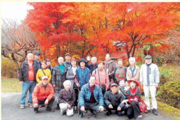
研修旅行 ～紅葉が綺麗でした～

今後もより良く健康寿命延伸に繋がる行事を会員みんなで考え、楽しいクラブづくりに努力していきたいと思っておりますので、よろしくご指導・ご協力をお願いいたします。