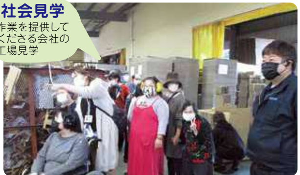
※会社の一員としての自信と喜びを実感!