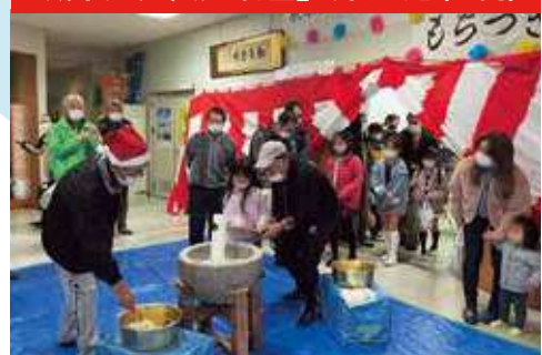
▲ 富士見地区 歳末たすけあい おたのしみもちつき大会