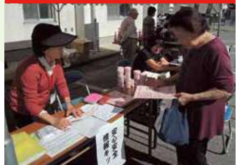
▲ 福祉協力員による安心・安全情報キットの配付