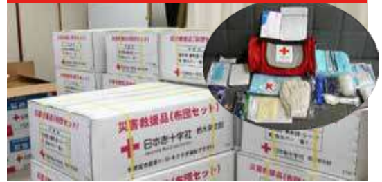
▲ 災害や火災等で被災した方への救援物資