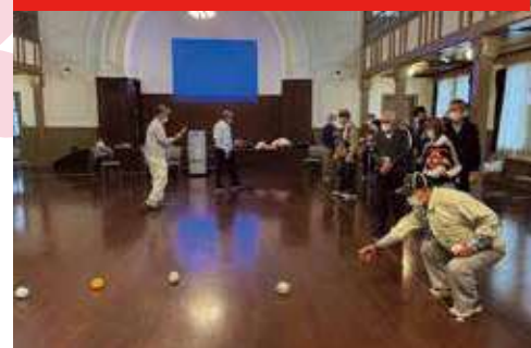
▲ 城東地区 宇大西ふれあいクラブ