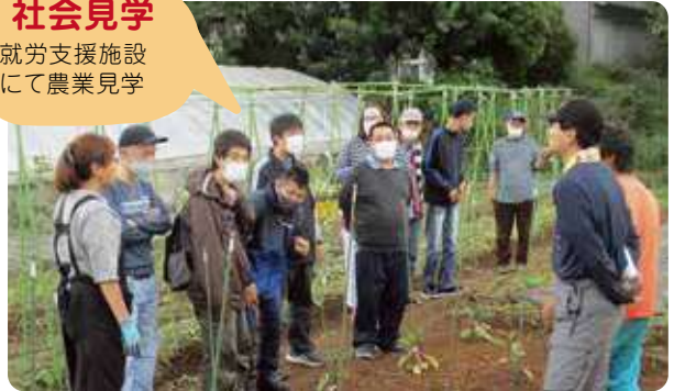
※畑のお仕事について勉強中!