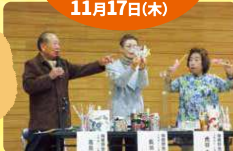
▲ふれあい・いきいきサロン瑞穂台