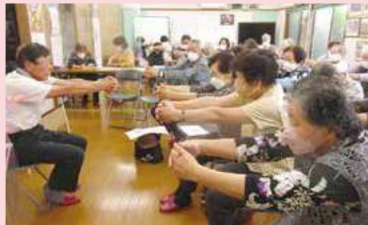
姿川地区 鶴中サロン