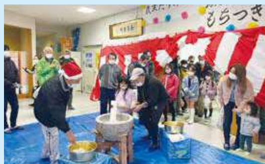
富士見地区社会福祉協議会