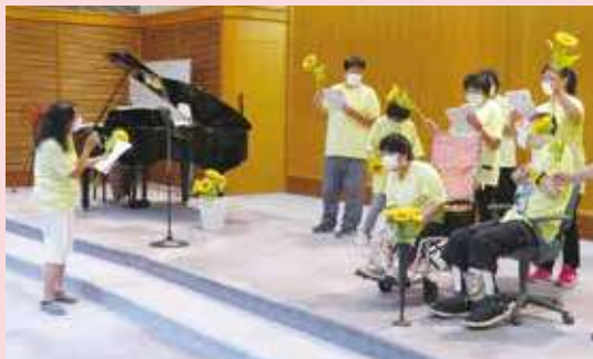
(一社) 栃木県手をつなぐ育成会