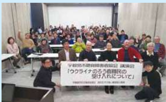
宇都宮市聴覚障害者協会