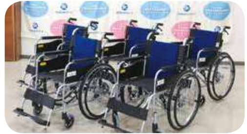
▲車いすのご寄附(R5の様子) 市民の方への貸出事業に活用しています