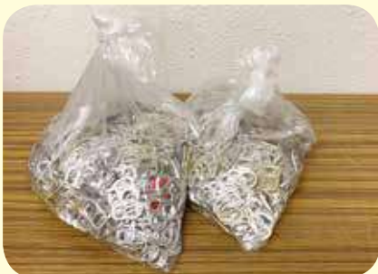
▲収集したプルタブはビニール袋などに入れる。