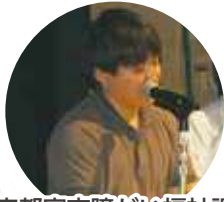
宇都宮市障がい福祉課