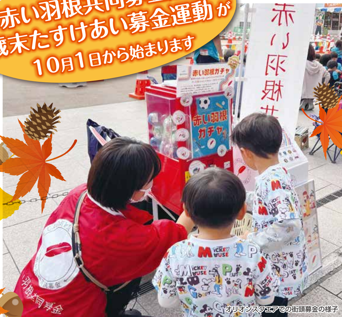
オリオンスクエアでの街頭募金の様子