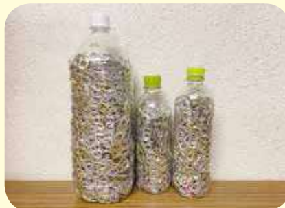
▲ペットボトルは不可。