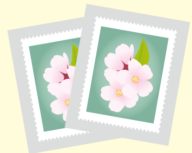
▲切手の周り1cmほど残して切る。

【お問い合わせ】 ボランティアセンター (総合福祉センター8階) 電話 636-1285 FAX 634-2870 ホームページもご覧ください。