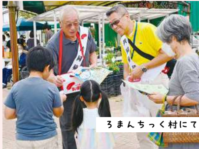
3まんちゅく村にて