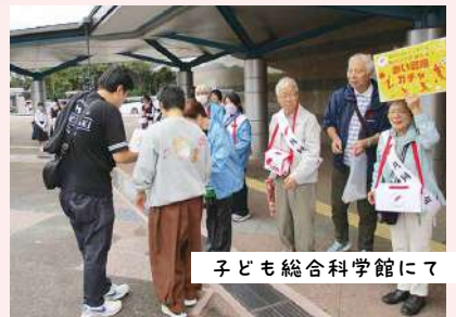
子ども総合科学館にて