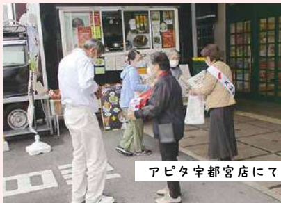
アピタ宇都宮店にて