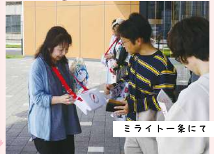
ミライトー条にて