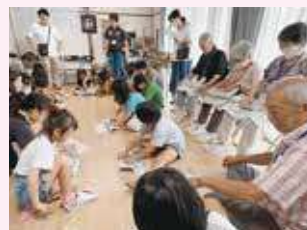
赤い羽根共同募金 「ふれあい・いきいきサロン」