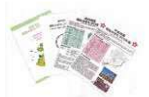
▲地区福祉のまちづくり計画の策定支援