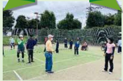
スポレク講座でテニス体験