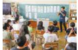
▲出前福祉共育講座の開催(手話体験)