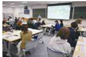
▲災害時における連携体制の構築(宇都宮災害支援ネットワーク連絡会)