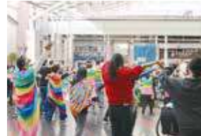
▲宇都宮市民福祉の祭典の開催