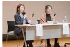
▲成年後見制度の普及啓発