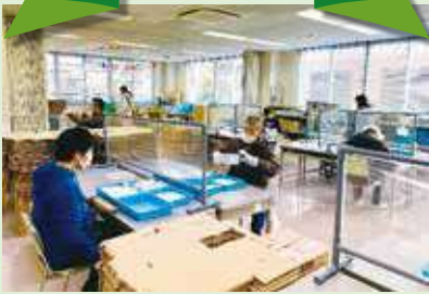
電気部品の組み立て作業