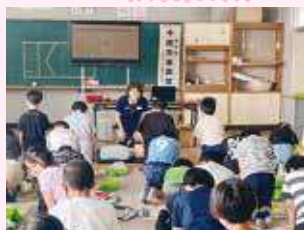
日赤活動資金 「市内小学校での救急法講習」