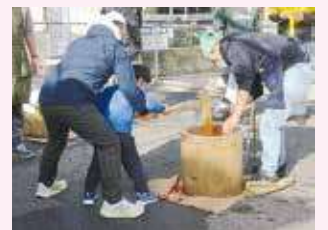
歳末たすけあい募金 「地域内での交流事業」