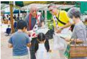
▲赤い羽根共同募金運動の推進