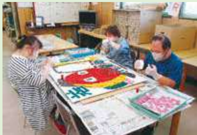
廃材利用の切り絵できびなの製作