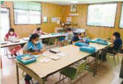
商品の袋詰め作業