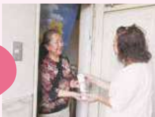
会員会費 「安心・安全情報キット配付事業」