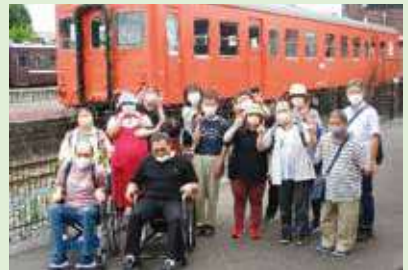
野外レクリエーション